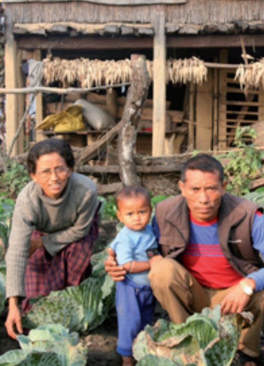
Kursseilla opitut uudet lajit ja viljelymenetelmät tehostavat ja monipuolistavat kasvimaan satoa.

■ Viime vuosina Nepalissa on eletty uudenaikaista toivon aikaa.