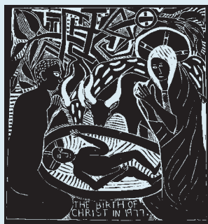
Illustration: John Muafangejo, "Kristi födelse 1977"